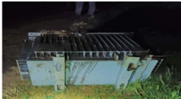
ΓΕΝΙΚΗ ΠΕΡΙΦΕΡΕΙΑΚΗ ΑΣΤΥΝΟΜΙΚΗ ΔΙΕΥΘΥΝΣΗ ΑΝΑΤΟΛΙΚΗΣ ΜΑΚΕΔΟΝΙΑΣ & ΘΡΑΚΗΣ/ Δ.Α. ΞΑΝΘΗΣ/ Υ.Α. ΞΑΝΘΗΣ

Από το Τμήμα Ασφάλειας Ξάνθης διακριβώθηκε η δράση ατόμων που δραστηριοποιούνταν στην κλοπή χαλκού από μετασηματιστές ΔΕΔΔΗΕ, σε περιοχές της Ξάνθης και της Ροδόπης.