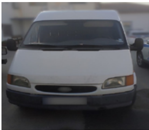
ΓΕΝΙΚΗ ΠΕΡΙΦΕΡΕΙΑΚΗ ΑΣΤΥΝΟΜΙΚΗ ΔΙΕΥΘΥΝΣΗ ΑΝΑΤΟΛΙΚΗΣ ΜΑΚΕΔΟΝΙΑΣ & ΘΡΑΚΗΣ / Δ.Α. ΑΛΕΞΑΝΔΡΟΥΠΟΛΗΣ / Τ.Σ.Φ. ΦΕΡΩΝ

Συνελήφθησαν 10 διακινητές οι οποίοι προωθούσαν στο εσωτερικό της χώρας, σε δέκα διαφορετικές περιπτώσεις, μη νόμιμους μετανάστες