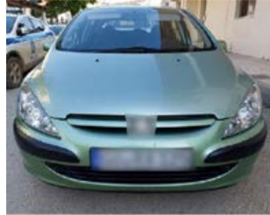
ΓΕΝΙΚΗ ΠΕΡΙΦΕΡΕΙΑΚΗ ΑΣΤΥΝΟΜΙΚΗ ΔΙΕΥΘΥΝΣΗ ΑΝΑΤΟΛΙΚΗΣ ΜΑΚΕΔΟΝΙΑΣ & ΘΡΑΚΗΣ/ Δ.Α. ΑΛΕΞΑΝΔΡΟΥΠΟΛΗΣ/ Τ.Σ.Φ. ΣΟΥΦΛΙΟΥ

Συνελήφθησαν σήμερα (2-7-2023) τις πρώτες πρωινές ώρες σε Επαρχιακή οδό του Έβρου, από αστυνομικούς του Τμήματος Συνοριακής Φύλαξης Σουφλίου της Διεύθυνσης Αστυνομίας Αλεξανδρούπολης δύο (2) αλλοδαποί διακινητές, οι οποίοι εμπλέκονται σε υπόθεση μεταφοράς μη νόμιμων μεταναστών.