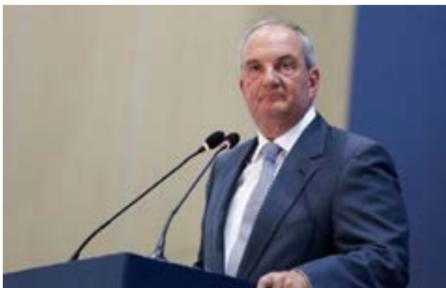
Ανανεώνει το κύρος της (prestige) η ΣΕΚΕ Α.Ε. – Ο πρώην Πρωθυπουργός Κ. Καραμανλής είναι ο νέος Πρόεδρος της ΣΕΚΕ