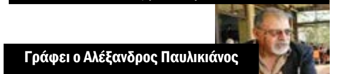
Γράφει ο Αλέξανδρος Παυλικιάνος