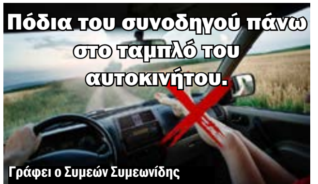
Πόδια του συνοδηγού πάνω στο ταμπλό του αυτοκινήτου.