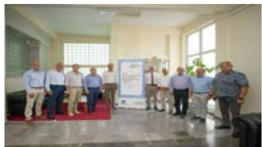
«Μαζί» το Κ.Υ. Σταυρούπολης και τα Γηροκομεία «Άγιος Παντελεήμων» και «Ο Μέγας Βασίλειος»

Δομές υγείας, μονάδες φροντίδας ηλικιωμένων και κοινωνικά φαρμακεία της